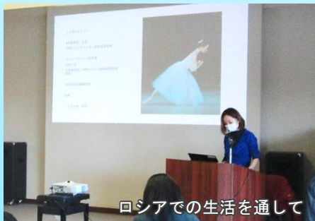
ロシアでの生活を通して

このセミナーは、様々な分野で活動している講師を招き、現在のグローバル化に対応すべく、私たちが知らない諸外国の社会情勢や文化について学び、国際理解について学習する講座です。