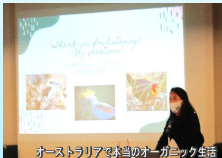
オーストラリアで本当のオーガニック生活